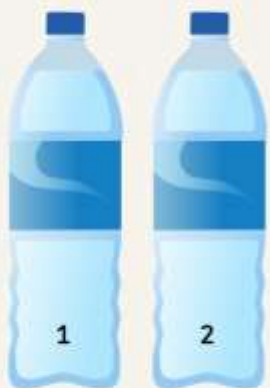
Deux bouteilles d'eau identiques