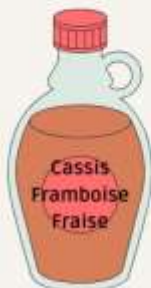
Sirop idéalement de cassis ou framboise / fraise